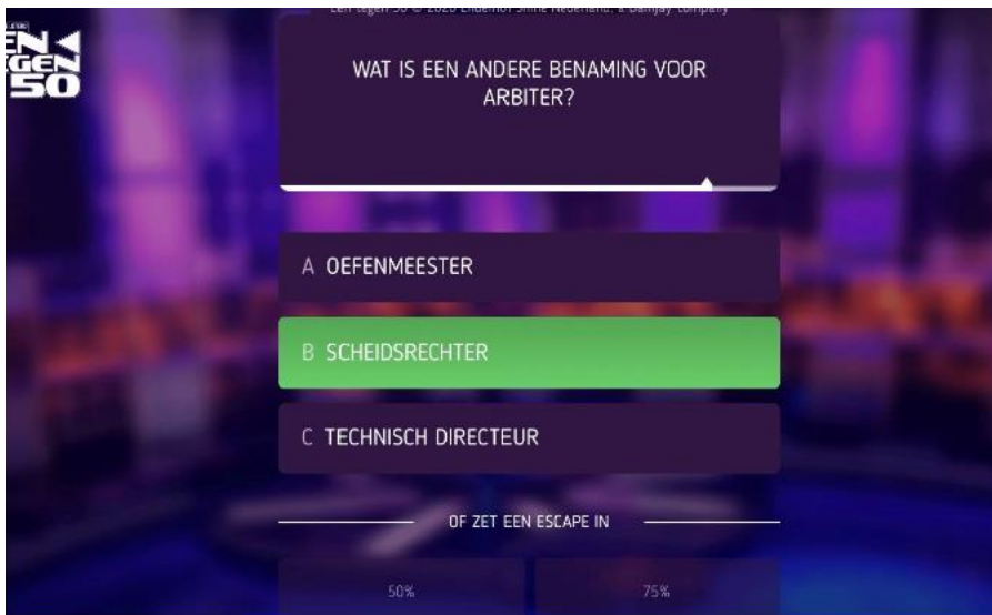
Afbeelding 3: EEN tegen 50

speler een vraag beantwoorden. Als de vraag goed is beantwoord gaat de speler door naar de volgende ronde en moet de speler weer kiezen tussen twee categorieën en vervolgens weer een vraag beantwoorden. Als de speler een vraag goed heeft beantwoord worden de tegenspelers die de vraag fout hebben beantwoord weggespeeld. Het doel van het spel is om alle vijftig tegenspelers weg te spelen. Elk weggespeelde tegenspeler levert een geldbedrag op. De speler kan tijdens het spelen van het spel escapes kopen.