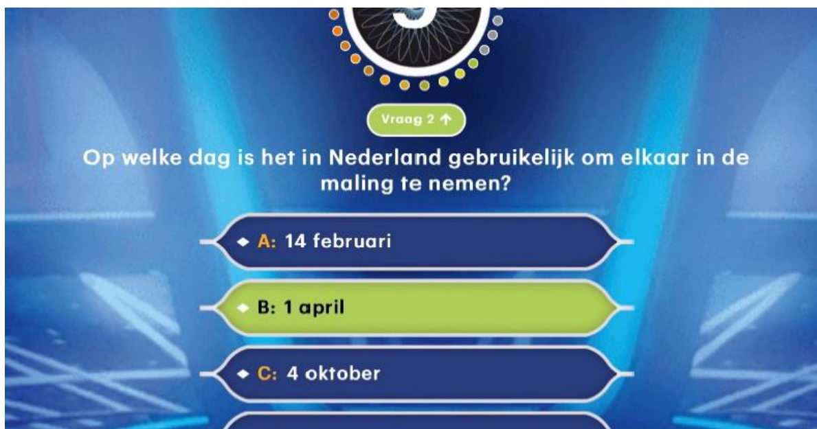
Afbeelding 1: Vrienden Loterij Miljonairs