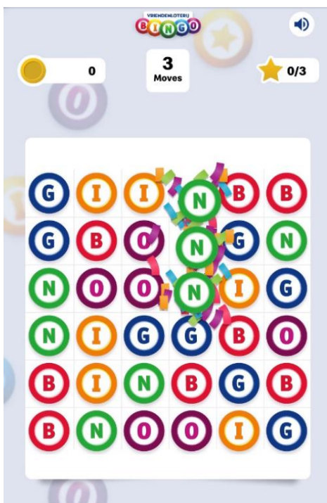
Afbeelding 3: Bingo Crush